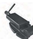
Etau EP 100 BF